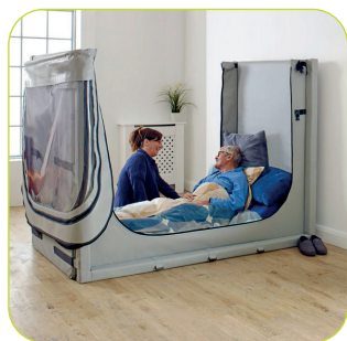
Myke og fleksible vegger