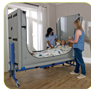
Valgfritt hev-/senkbart understell