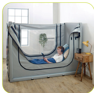
Skjermet og lavstimulerende miljø