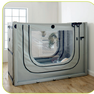
Modulær design som kan tilpasses endrede behov